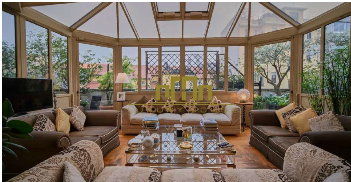
Luminoso salone con veranda e terrazzo

V ia Bullona , in palazzo signorile, con ampio giardino condominiale, servizio di portineria e sistema di sorveglianza, proponiamo attico di 224 mq con veranda e terrazzo di 48 mq. L'immobile è così composto: al quarto piano ingresso, ampio salone doppio con veranda e terrazzo, sala da pranzo, cucina abitabile, camera da letto con cabina armadio, doppi servizi e locale lavanderia, camera di servizio con bagno; al quinto piano, collegato da scala interna, tre camere con servizio. L'accesso al quinto piano e' sia dall'interno che indipendente. In ottimo stato, parquet in tutta la casa, infissi in legno. Completa la proprietà doppia cantina. L'appartamento grazie alle numerose finestre ed essendo ad un piano alto, è molto luminoso e silenzioso. Possibilità di acquistare un box doppio di 38 mq al prezzo di euro 100.000.